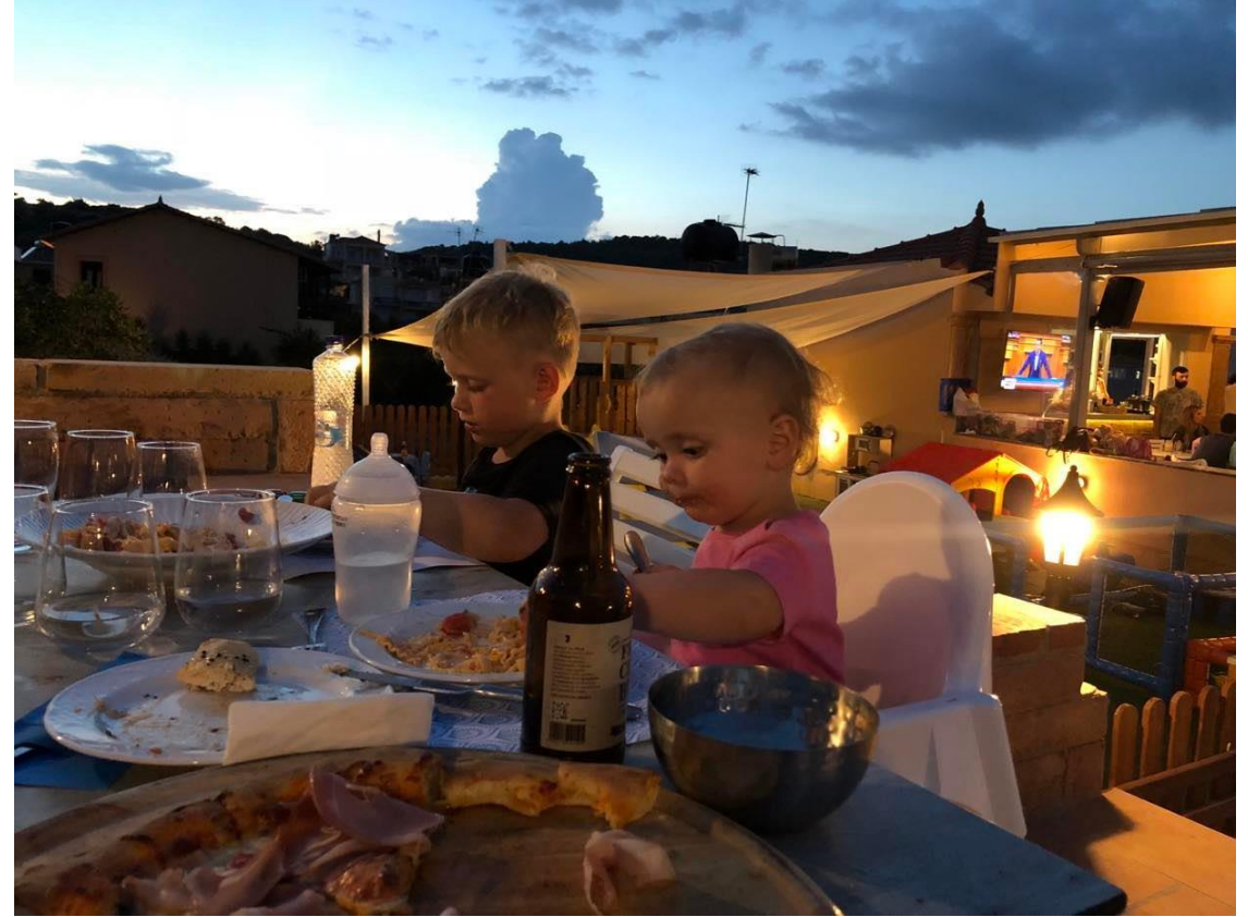
Restauracja przyjazna rodzinom - Chios, Grecja