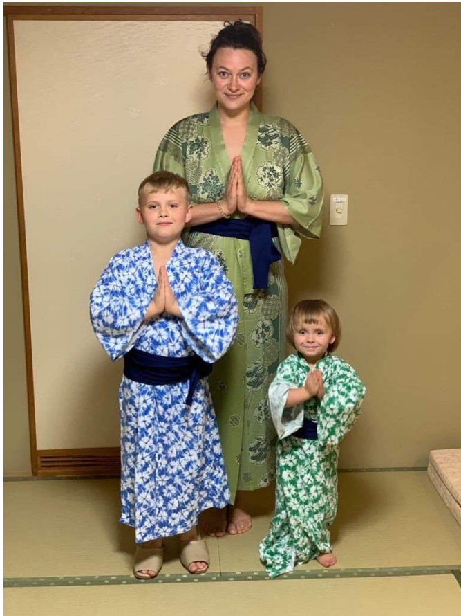
Kimona dla całej rodziny – Noboribetsu, Japonia