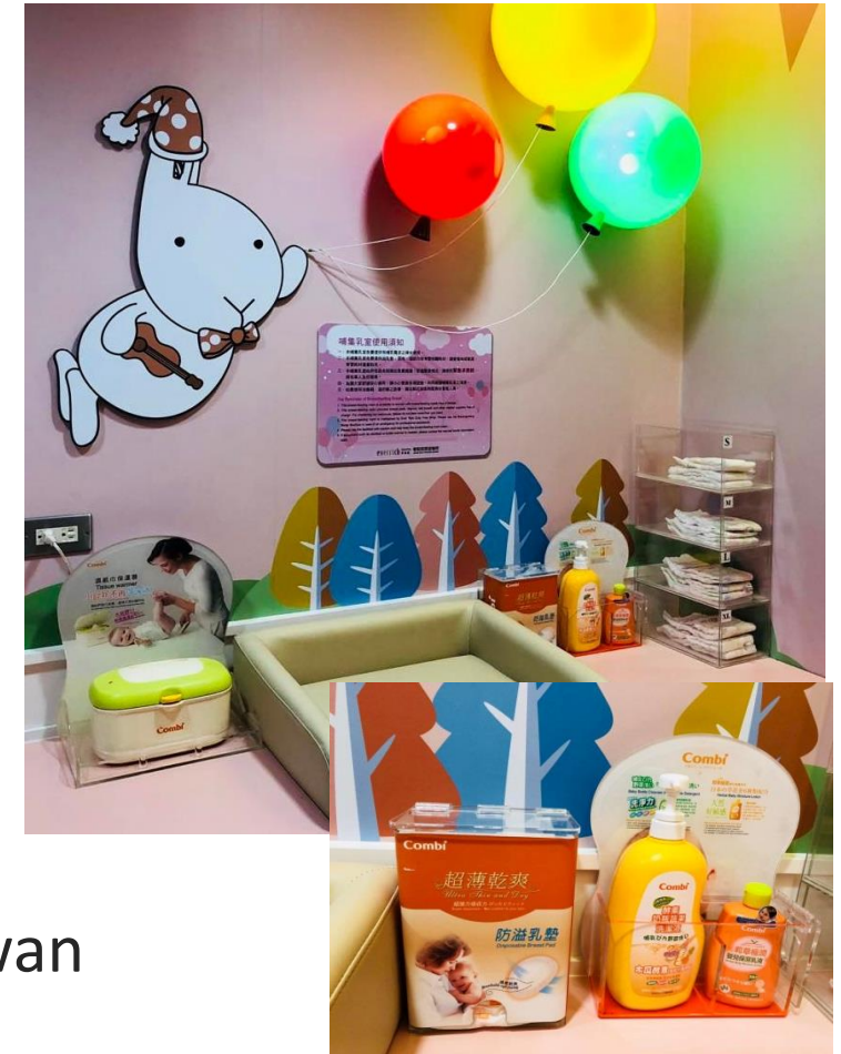
Breastfeeding Room – Taichung International Airport, Taiwan