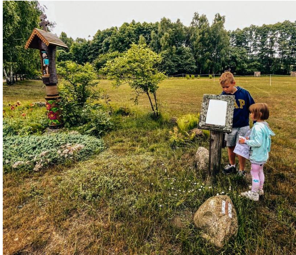
Pensjonat Uroczysko Zaborek