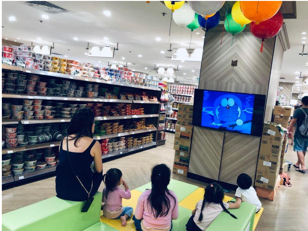
Singapur dba o spokój rodziców