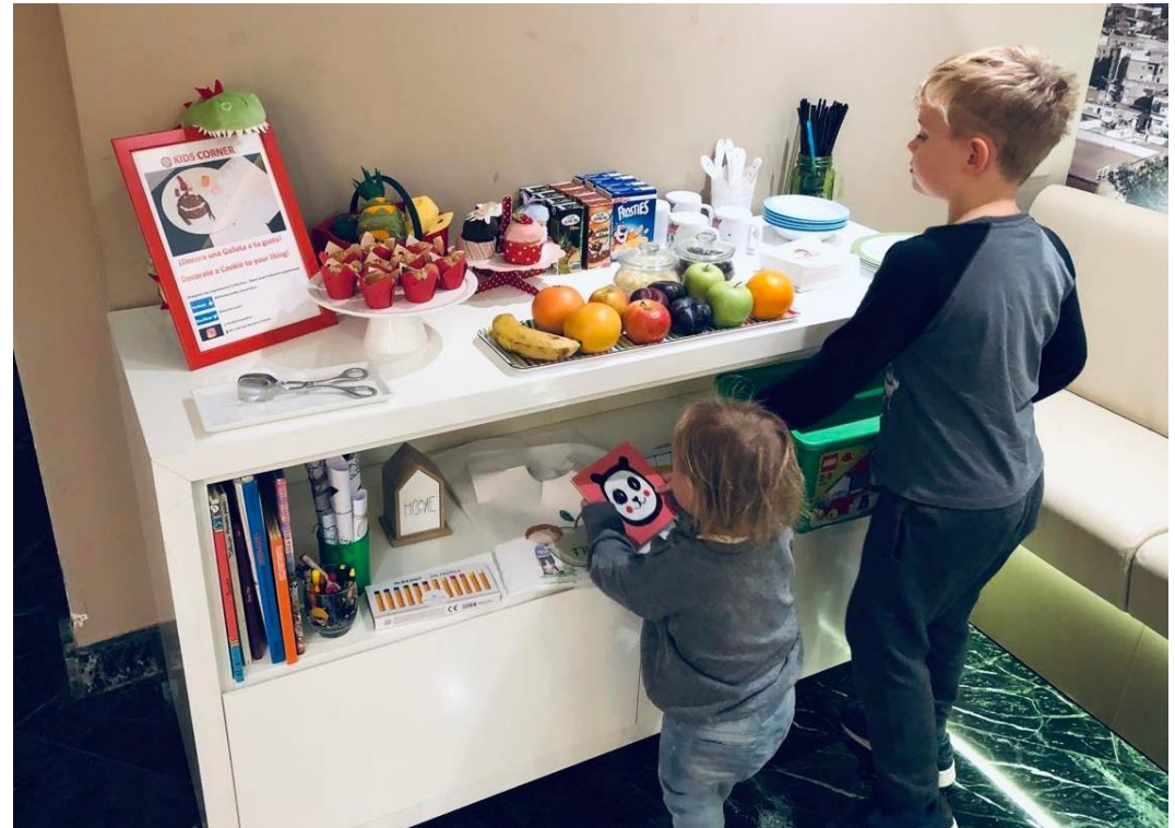
Bufet dla dzieci - smaczny i w dobrym stylu (Barcelona)