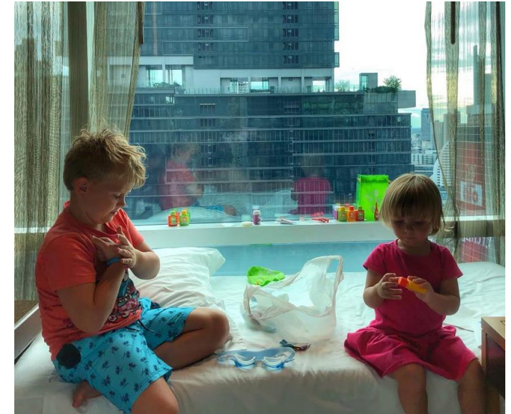
Dedykowane zestawy kosmetyków dla dzieci – hotel Eastin Grand Sathorn, Bangkok – radość i zabawa