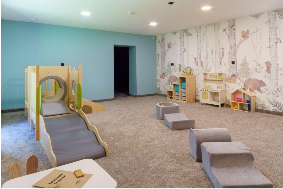
Hotel SZUMY PARK