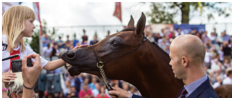
Spotkanie na Pride of Poland

10. Festiwal Kaszy GRYZCZAKI w Janowie Lubelskim nawiązuje do typowych dla południowo-zachodniej części regionu upraw gryki i wyrabianej z niej kaszy gryczanej, która jest jednym z podstawowych składników tradycyjnej kuchni, w tym popularnych gryczaków. Smak placków z farszem z kaszy gryczanej i sera, pieczonych w chlebowym piecu, chwalą sobie znani kucharze i promotorzy kulinariów, goszczący corocznie na janowskim festiwalu.