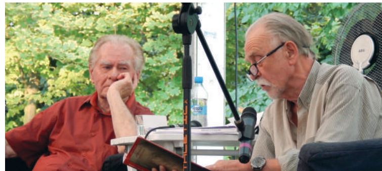
Festiwal Stolica Języka Polskiego Szczepieszyn

8. Festiwal Stolica Języka Polskiego Szczepieszynie to tygodniowy maraton autorskich spotkań, warsztatów, wieczorków, recitali i innych wydarzeń, w których gośćmi są wybitni polscy pisarze, poeci, dziennikarze, wydawcy, językoznawcy, aktorzy, piosenkarze. To festiwal, gdzie rano można wybrać się na spacer, albo odbyć literacki warsztat ze znanym twórcą, a wieczorem posłuchać recytacji czołowych polskich aktorów.