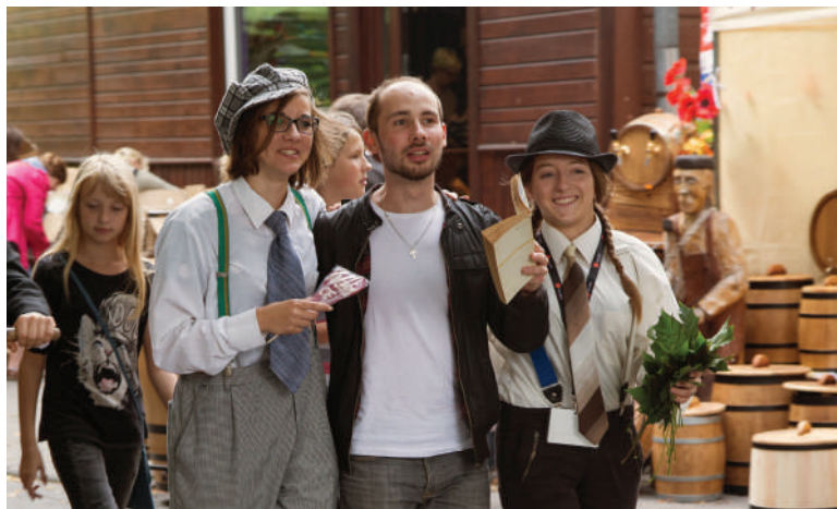
Festiwal Trzech Kultur we Włodawie