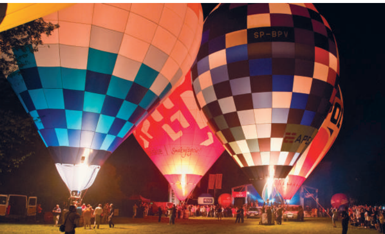
Międzynarodowe Zawody Balonowe, fot. LOT Kraina Lessowych Wąwozów