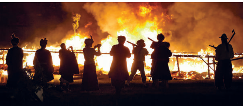
Widowisko historyczne - Szturm twierdzy Zamość, fot. Wojciech Chudzik