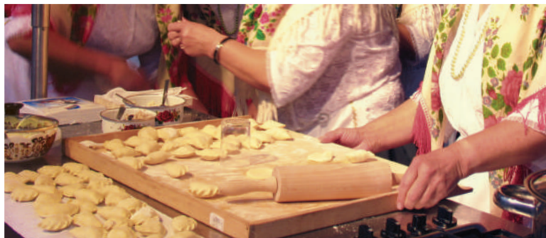
Europejski Festiwal Smaku w Lublinie