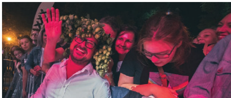
Wieczorny koncert na Chmielakach

12. Dni Konia Arabskiego „Pride of Poland” w Janowie Podlaskim. Słynna stadnina już od pół wieku organizuje najważniejszą aukcję koni z państwowych i prywatnych hodowli, na którą przyjeżdżają kupcy i miłośnicy tych zwierząt z całego świata. Aukcji towarzyszy Narodowy Czempionat Koni Arabskich Czystej Krwi.