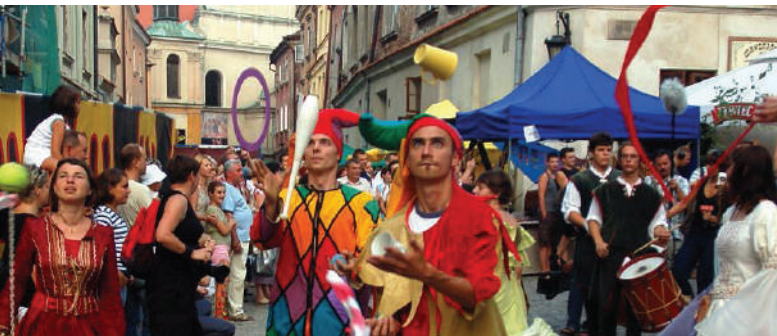
Jarmark Jagielloński w Lublinie, fot. M. Pietrusza