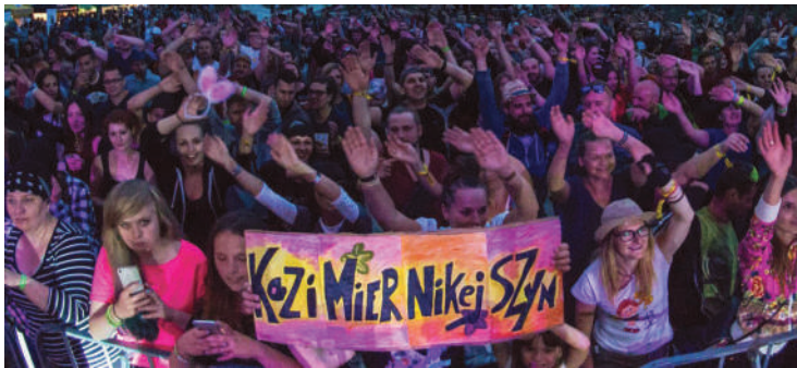
Kazimiernikejszyn, fot. Mateusz Stachyra

6. Kazimiernikejszyn w Kazimierzu Dolnym to energetyczne koncerty z magią nadwiślańskiego miasta oraz całonocna strefa relaksu z autorskimi czasoumiloczami. Wszystko w luźnej atmosferze relaksu, improwizacji i wspólnej zabawy w różnych, czasem zaskakujących miejscach Kazimierza i okolic. Koncerty w kamieniołomach, paprowędrowki, rajdy, spływy kajakowe, spotkania na dzikiej wiślanej plaży, a na koniec dnia - silent disco na środku miasta.