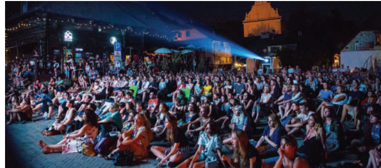
Festiwal Dwa Brzegi - nocny seans na Małym Rynku

7. Festiwal Filmu i Sztuki DWA BRZEGI w Kazimierzu Dolnym to jeden z najciekawszych filmowych festiwali w kraju. W programie wielodniowej imprezy, obok seansów kinowych z obrazami nagradzonymi w Berlinie, Cannes, Locarno czy Sundance, są spotkania z twórcami kina, koncerty, wystawy i inne klimatyczne wydarzenia, rozgrywane w zabytkowych obiektach i nadwiślańskich plenerach Kazimierza, Mięćmierza, Janowca.