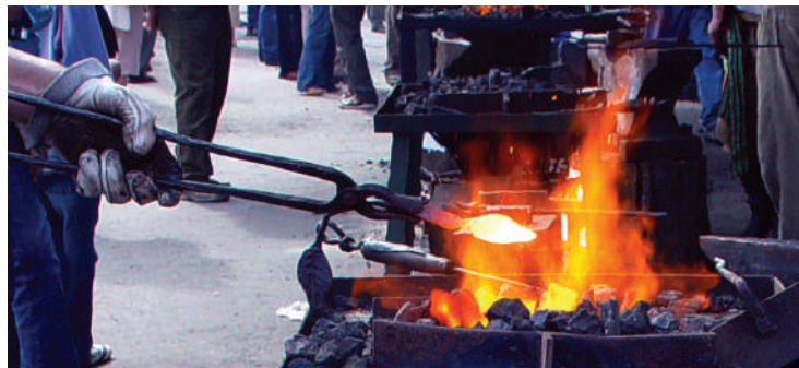
Warsztaty kowalskie w Wojciechowie