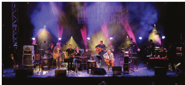
Festiwal INNE BRZMIENIA w Lublinie - koncert zespołów Voo Voo i Raz Dwa Trzy