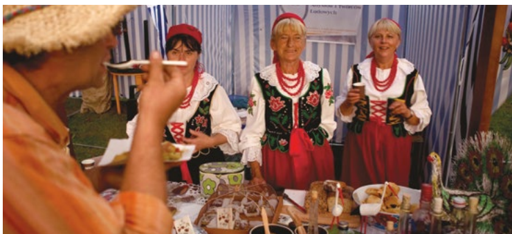
Na Festiwalu Kaszy GRYCZAKI w Janowie Lubelskim

10. Festiwal Kaszy GRYCZAKI w Janowie Lubelskim nawiązuje do typowych dla południowo-zachodniej części regionu upraw gryki i wyrabianej z niej kaszy gryczanej, która jest jednym z podstawowych składników tradycyjnej kuchni, w tym popularnych gryczaków. Smak placków z farszem z kaszy gryczanej i sera, pieczonych w chlebowym piecu, chwałą sobie znani kucharze i promotorzy kulinariów, goszczący corocznie na janowskim festiwalu.