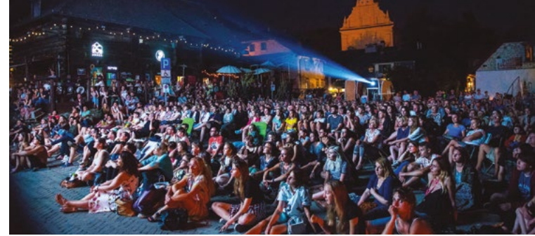
Festiwal Dwa Brzegi - nocny seans na Małym Rynku

7. Festiwal Filmu i Sztuki DWA BRZEGI w Kazimierzu Dolnym to jeden z najciekawszych filmowych festiwali w kraju. W programie wielodniowej imprezy, obok seansów kinowych z obrazami nagradzonymi w Berlinie, Cannes, Locarno czy Sundance, są spotkania z twórcami kina, koncerty, wystawy i inne klimatyczne wydarzenia, rozgrywane w zabytkowych obiektach i nadwiślańskich plenerach Kazimierza, Mięćmierza, Janowca.