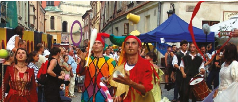
Jarmark Jagielloński w Lublinie