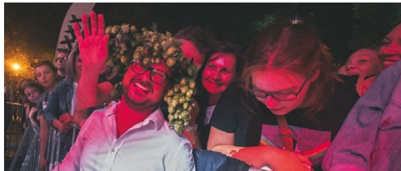
Wieczorny koncert na Chmielakach, fot. chmielaki.pl

12. Dni Konia Arabskiego „Pride of Poland” w Janowie Podlaskim. Słynna stadnina już od pół wieku organizuje najważniejszą aukcję koni z państwowych i prywatnych hodowli, na którą przyjeżdżają kupcy i miłośnicy tych zwierząt z całego świata. Aukcji towarzyszy Narodowy Czempionat Koni Arabskich Czystej Krwi.