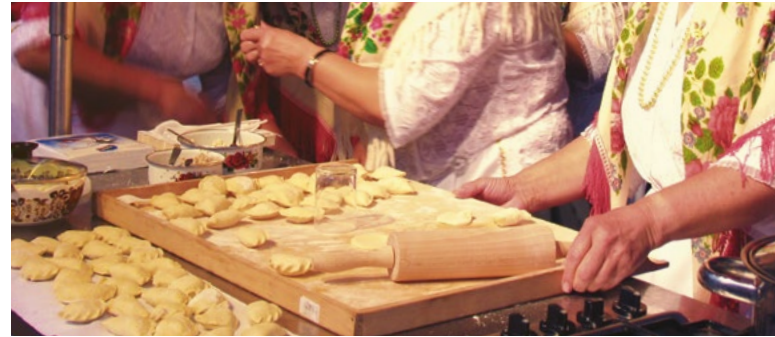
Europejski Festiwal Smaku w Lublinie

15. Europejski Festiwal Smaku w Lublinie to największa w regionie prezentacja tradycyjnej kuchni, a także kuchni naszych sąsiadów z Południowej i Wschodniej Europy. Festiwalowa Scena Smaku jest miejscem pokazów kulinariów oraz koncertów, a w Miasteczku Smaku można próbować i kupować regionalne produkty.