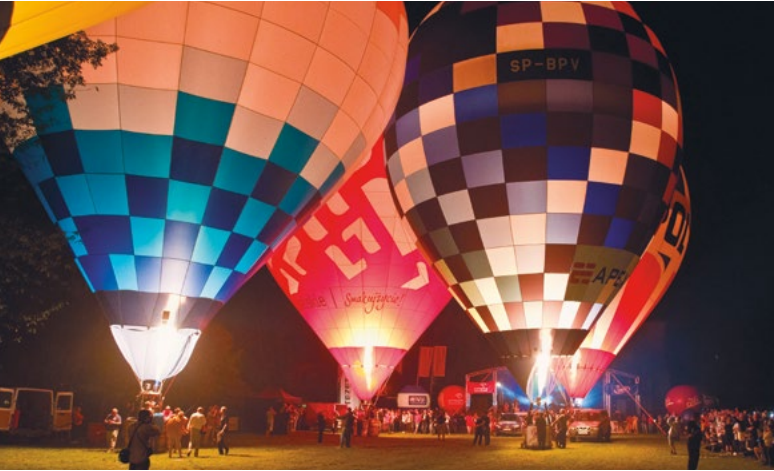
Międzynarodowe Zawody Balonowe

14. Jarmark Jagielloński w Lublinie to święto tradycji i kultury ludowej nawiązujące do starej tradycji Jarmarków Lubelskich. Wśród setek targowych stoisk spotkać można artystyczne i rękodzielnicze wyroby z różnych regionów Polski oraz krajów Europy Środkowej i Wschodniej. Jarmarkowi towarzyszą barwne pochody, uliczne popisy kuglarzy, grąjków oraz koncerty i spektakle.