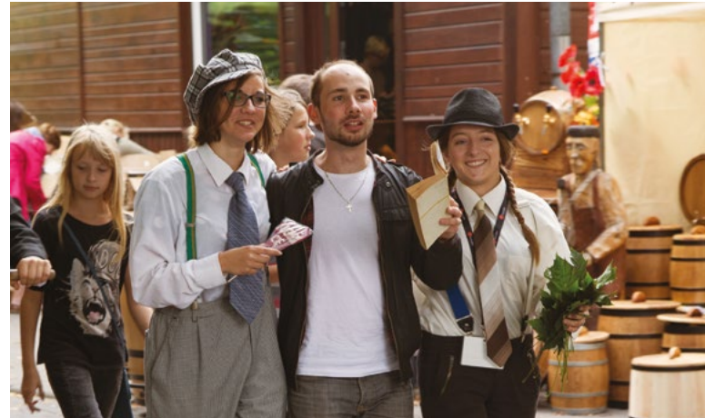
Festiwal Trzech Kultur we Włodawie

16. Festiwal Trzech Kultur we Włodawie przypomina i popularyzuje wieloreligijną i wielokulturową tradycję nadbużańskiego miasta. W programie są koncerty, recitale, spektakle, wystawy, warsztaty, a także nabożeństwa. Większość tych wydarzeń odbywa się w trzech włodawskich świątyniach: kościele, cerkwi, synagodze.