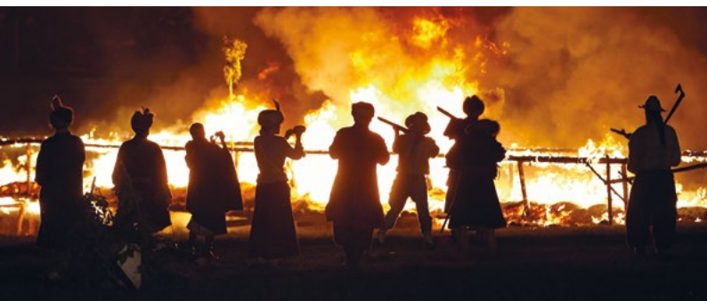
Widowisko historyczne - Szturm twierdzy Zamość

2. Ogólnopolski Festiwal Kapel i Śpiewaków Ludowych w Kazimierzu Dolnym. Najważniejsze i największe w Polsce wydarzenie promujące autentyczną twórczość muzyczną mieszkańców wsi i małych miasteczek, w którym bierze udział ponad tysiąc twórców, wybranych w regionalnych eliminacjach. Barwne korowody artystów, koncerty, zabawy taneczne oraz towarzyszące festiwalowi Targi Sztuki Ludowej nadają nadwiślańskiemu miastu szczególnie i niepowtarzalnego kolorytu.