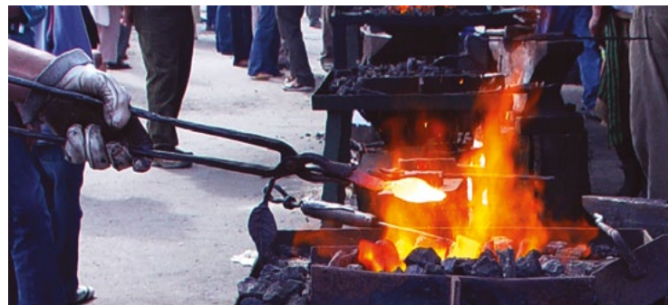
Warsztaty kowalskie w Wojciechowie

3. Ogólnopolskie Warsztaty Kowalskie w Wojciechowie przyciągają z całego kraju adeptów i pasjonatów tego rzemiosła. Miejszem praktycznej nauki, prowadzonej przez mistrzów, jest miejscowa kuźnia rodziny Czernieców, a inspiracji mogą dostarczyć liczne eksponaty zgromadzone w wojciechowskim Muzeum Kowalstwa. Warsztaty kończą się parodniowymi Targami Sztuki Kowalskiej. Co dwa lata organizowane są Ogólnopolskie Spotkania Kowali z udziałem mistrzów tego rzemiosła.