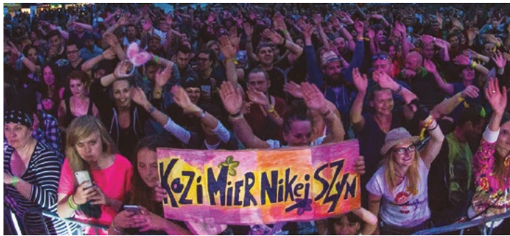
Kazimierniejszyn, fot. Mateusz Stachyra

6. Kazimierniejszyn w Kazimierzu Dolnym to energetyczne koncerty z magią nadwiślańskiego miasta oraz całodniowa strefa relaksu z autorskimi czasoumilaczami. Wszystko w luźnej atmosferze relaksu, improwizacji i wspólnej zabawy w różnych, czasem zaskakujących miejscach Kazimierza i okolic. Koncerty w kamieniołomach, paprowędrowki, rajdy, spływy kajakowe, spotkania na dzikiej wiślanej plaży, a na koniec dnia - silent disco na środku miasta.