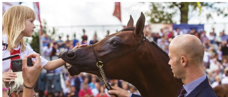
Spotkanie na Pride of Poland, fot. Robert Lesiuk