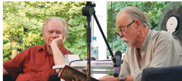
Festiwal Stolica Języka Polskiego Szczeczeszyn

8. Festiwal Stolica Języka Polskiego w Szczeczeszynie to tygodniowy maraton autorskich spotkań, warsztatów, wieczorków, recitali i innych wydarzeń, w których gośćmi są wybitni polscy pisarze, poeci, dziennikarze, wydawcy, językoznawcy, aktorzy, piosenkarze. To festiwal, gdzie rano można wybrać się na spacer, albo odbyć literacki warsztat ze znanym twórcą, a wieczorem posłuchać recytacji czołowych polskich aktorów.