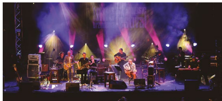
Festiwal INNE BRZMIENIA w Lublinie - koncert zespołów Voo Voo i Raz Dwa Trzy